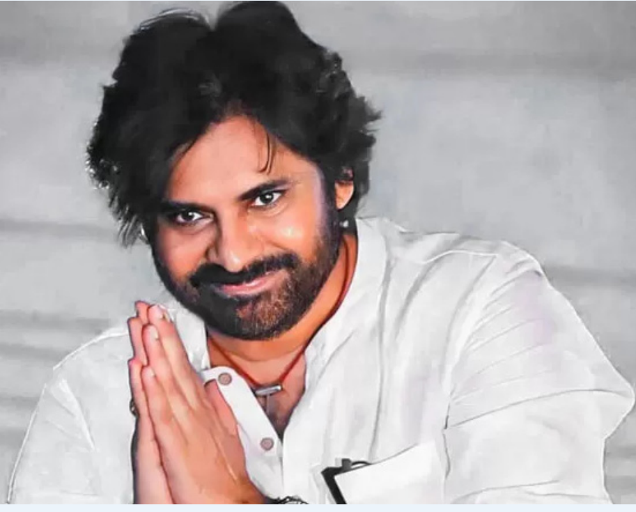
వెళ్లారు. అప్పట్లో కూడా ఏపీ డిప్యూటీ సీఎం గా ఉన్న పవన్ కల్యాణ్ ను ఎందుకు తీసుకువెళ్లేదు అనేది ప్రశ్న వచ్చింది. కానీ అప్పట్లోనే పవన్ కల్యాణ్ పరోక్ష సంతకాలు ఇచ్చారు. ఎటువంటి అసంతృప్తి వ్యక్తం చేయలేదు. ఇప్పుడు కూడా పవన్ కల్యాణ్ ను సంప్రదించి ఉంటారని విశ్లేషకులు అభిప్రాయపడుతున్నారు.

మరో వైపు గత ఏడాది దావోస్ లో జరిగిన పెట్టుబడుల సదస్సుకు సీఎం చంద్రబాబుతో పాటు నారా లోకేష్ వెళ్లారు. ఆ సమయంలో కూడా పవన్ కల్యాణ్ వెళ్లకపోవడం పై విమర్శలు వచ్చాయి. ముఖ్యంగా జనసేన కేడర్ నుంచి అసంతృప్తి బయటపడింది. ఇప్పుడు కూడా సోషల్ మీడియా వేదికగా అటువంటి అసంతృప్తి కనిపిస్తోంది. తెలంగాణలో మెగాస్టార్ చిరంజీవిని తమ వెంట తీసుకెళ్లి దావోస్ ప్రపంచ ఆర్థిక సదస్సులో భాగస్వామ్యం కల్పించింది తెలంగాణ ప్రభుత్వం. తెలంగాణ ఇమేజ్ పెరిగింది అన్న కామెంట్స్ వినిపిస్తున్నాయి. కానీ ఏపీలో డిప్యూటీ సీఎం గా ఉన్న పవన్ కల్యాణ్ ను ప్రపంచ ఆర్థిక సదస్సుకు తీసుకెళ్లకపోవడం పై విమర్శలు వస్తున్నాయి. అయితే పవన్ విషయంలో చంద్రబాబు ఎప్పుడు జాగ్రత్తగానే ఉంటారు. డిప్యూటీ సీఎం గా ఉన్న పవన్ ను సంప్రదించి అన్నీ చేస్తుంటారని తెలుస్తోంది. ప్రపంచ పెట్టుబడుల సదస్సుకు సంబంధించిన ఏ శాఖ కూడా పవన్ కల్యాణ్ పరిధిలో లేదు. ఆయన అంత గ్రామీణ నేపథ్యం, అటవీ శాఖ వంటి వాటిని చూస్తున్నారు. అది నుంచి విదేశీ పర్యటనల విషయంలో పవన్ జోక్యం చేసుకోవడం లేదు. రాష్ట్రానికి పెట్టుబడులు తీసుకురావడంలో కూడా పవన్ పాత్ర అంతంత మాత్రమే. గత ఏడాది తెలంగాణ సీఎం వెంట ఆ రాష్ట్ర డిప్యూటీ సీఎం మల్ల భట్టి విక్రమార్కు