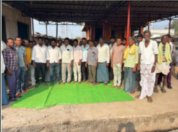
ఆదిలాబాద్ జిల్లా, జనవరి 24 (భారత శక్తి):