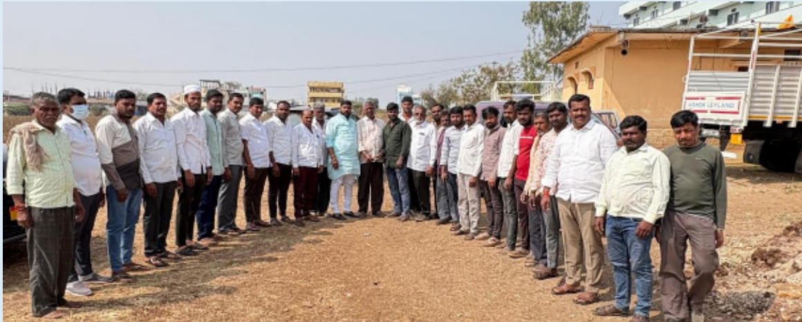
సంగారెడ్డి, భారతశక్తి ప్రతినిధి, జనవరి 24: